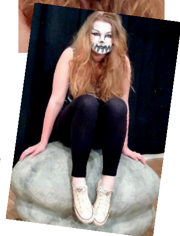
(v. l. n. r.: Pinocchio, Wasserpfeife rauchende Raupe, Kleines Kaninchen, Grinsekatze)

Ermöglicht wurde der Workshop durch die Aktion KidS (Künstler in die Schulen), die der Landesverband Theater in Schulen (LV.TS) organisiert und die von der Stiftung Rheinland-Pfalz für Kultur finanziert wird.